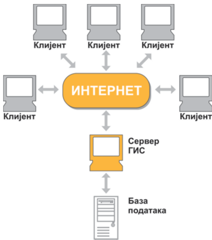
Слика: Проток информација и докумената између корисника општинског ГИС-а

У највећем броју случајева ради се о пословима који се односе на: