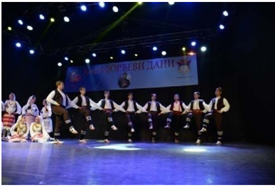
Слика бр. 5 Наступ КУД-а поводом „Карађорђевих дана“