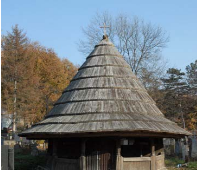
Слика бр. 4 Црква Брвнара

Црква брвнара, је једна од најстаријих цркава у овом крају, саграђена је од брвна и покривена шиндром. Постоји предање да је у њој крштен Ђорђе Петровић Карађорђе. Данас је ова црква под заштитом државе као историјски споменик.