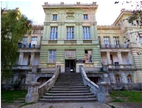
Слика бр. 3 Карађорђевог дома

Црква брвнара, је једна од најстаријих цркава у овом крају, саграђена је од брвна и покривена шиндром. Постоји предање да је у њој крштен Ђорђе Петровић Карађорђе. Данас је ова црква под заштитом државе као историјски споменик.