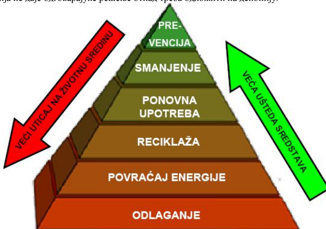
Слика 2 - Пирамида хијерхије у управљању отпадом

Концепт хијерархије управљања отпадом указује да је најефективније решење за животну средину смањење настајања отпада. Међутим, тамо где даље смањење није практично примењиво, производи и материјали могу бити искоришћени поново, било за исту или другу намену. Уколико та могућност не постоји, отпад се даље може искористити кроз рециклажу или компостирање или за добијање енергије. Само ако ни једна од претходних опција не даје одговарајуће решење отпад треба одложити на депонију.